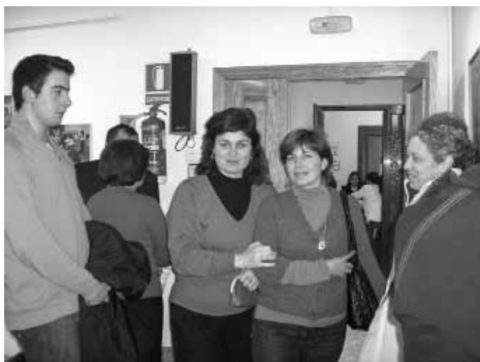
SOLICITUD AYUDAS CULTURA