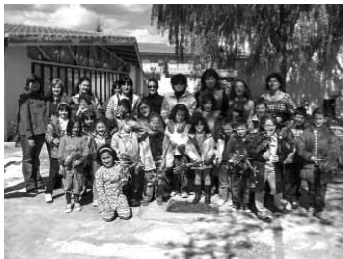
SEMANA DEL LIBRO