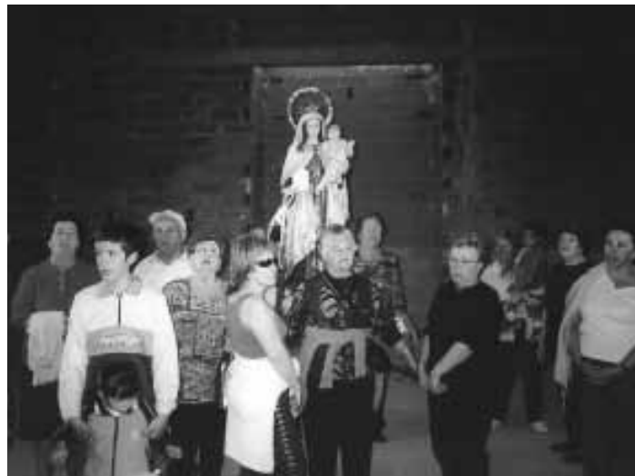
ROMERÍA A LA CAÑADA