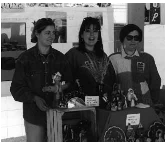
Stand de la Universidad Popular de Alborea en el encuentro UUPP de Hellín