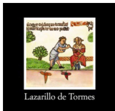
Lazarillo de Tormes

Por ello hacemos las siguientes recomendaciones: