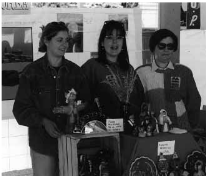
Stand de la Universidad Popular de Alborea en el encuentro UUPP de Hellín